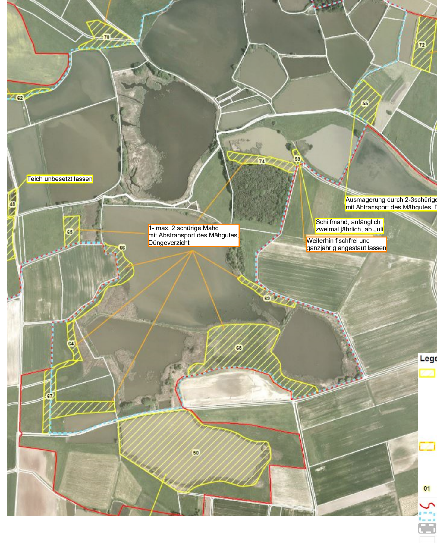
Ausschnitt Managementplan für das FFH-Gebiet 631-371 "Teiche und Feuchtwiesen im Aischgrund, Wehrgelände bei Mohrdorf", Karte 2; Erhaltungs- und Wiederherstellungsmaßnahmen für Lebensraumtypen und Arten der FFH-Richtlinien, Blatt Nr. 68