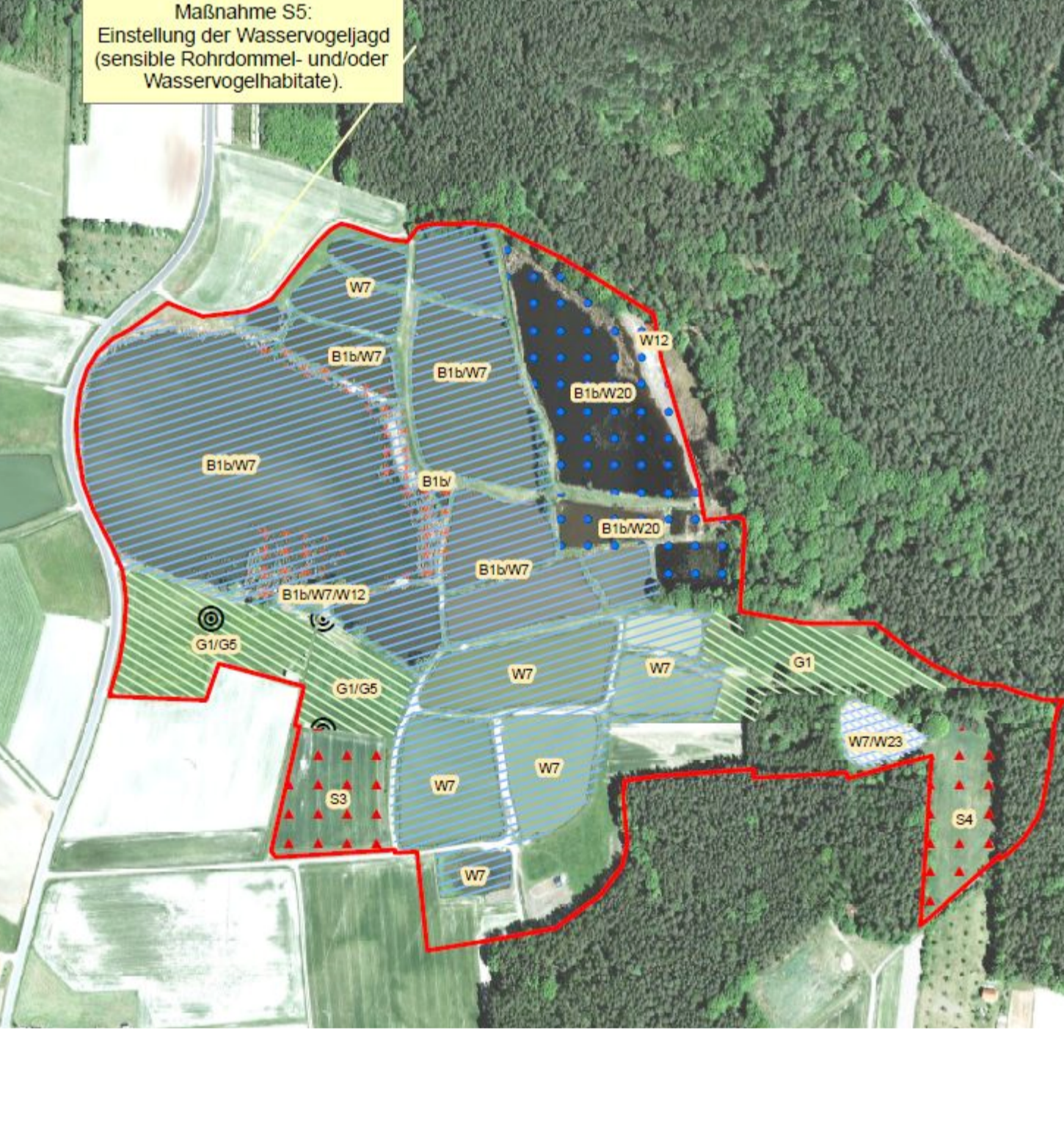
Ausschnitt Managementplan für das FFH-Gebiet 631-371 "Teiche und Feuchtwiesen im Aischgrund, Wehrgelände bei Mohrdorf", Karte 2; Erhaltungs- und Wiederherstellungsmaßnahmen für Lebensraumtypen und Arten der FFH-Richtlinien, Blatt Nr. 68